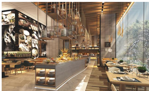
<オールデイダイニング「オアシス」内観>

館内には 4 つの料飲施設があり、日本料理「飛翔」、オールデイダイニング「オアシス」、ロビーラウンジ「カーブ 55」、そしてプールバーを用意しております。ご朝食は、タイ料理をはじめとする国際的な朝食をbuffetスタイルで提供するオールデイダイニング「オアシス」、または日本料理「飛翔」にて、和食料理長が腕を奮い取り揃える、種類豊富な和食buffetよりお選びいただけます。