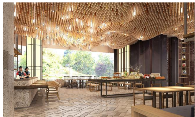
<日本料理「飛翔」内観>