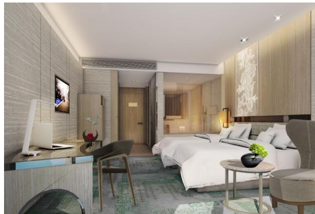
<ゲストルーム イメージ図>