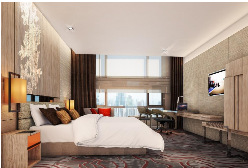
<ゲストルーム イメージ図>

当ホテルは、バンコクにおける初のニッコー・ホテルズ・インターナショナルのホテルとなり、このたびの開業に際して特別料金をご用意しております。